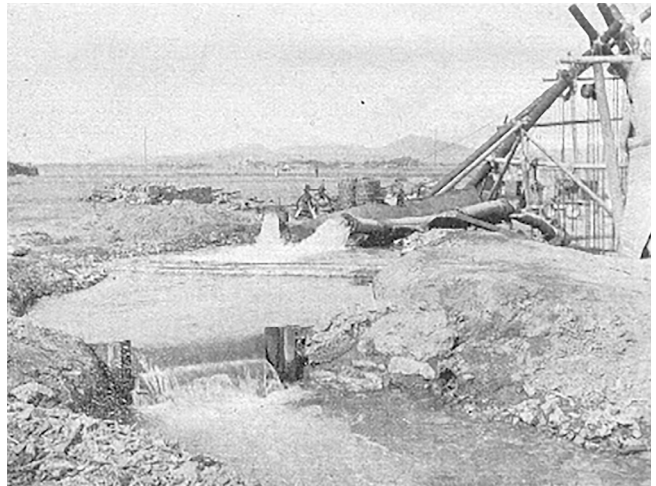
関東州内における地下水源の利用（1932年頃）

1950年、「良種」や新式農具の普及は農業技術指導站を通して行われた。1951年には農業技術指導站が3か所、1952年85か所、1953年903か