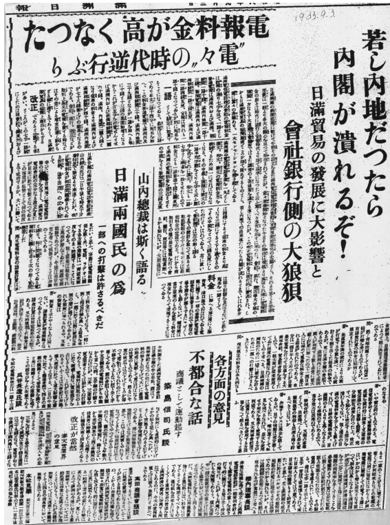
『満洲日日新聞』（1933年9月3日）の紙面

満洲電電は設立直後に大きな問題に直面してしまったわけだが、電気通信インフラの整備は着実に進んだ。満洲電電の現業管理局は大連、新京、奉天、哈爾濱、齊齊哈爾、承德、1938年から牡丹江が新設され、計7管理局が存在した。現業局数の推移は、奉天管理局において1935年の142局から1942年には281局へ、新京管理局において138局から182局へと増設されているが、いっそう大きな増大を示しているのは、北滿の哈爾濱管理局及び牡丹江管理局である。この地域では83局から344局へと増設されており、北滿地方が重点地域であったことがわかる。