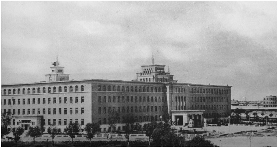
満洲電信電話本社