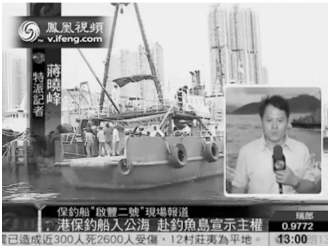
香港の活動家の船から報道するフェニックスTV記者

反日デモについても、古くからの歴史的な経緯で、本当に日本が嫌いで反日デモに参加した大衆の民意が、すっぱりと抜け落ちている。中国人の行動はすべて