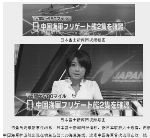
釣魚島最新事件消息：日本富士新闻网报道称，据日本政府人士透露，两艘中国海军护卫舰出现在钓鱼岛西北80海里海域。这是中国海军首次出现在这一地区。

あの時、わがテレビ局の中でさえ、私が中国を弁護する発言をすると、ときどき「空回り」しているような感覚を覚えることもあった。この種の説得は、大勢の前ではなく、少人数の幹部の間でまぎれなく進めていった。しかし、現場で制作しているスタッフたちの熱意もまた削ぐことはできない。スタッフが社会に対して張っているアンテナに引っかかってきたこと自体、社会の実態や空気を反映している。それに、関心を高める視聴者を、相手にしなくてもよいというわけにはいかない。ネガティブな中国イメージを抱き、「理解したいこと」しか耳に入らないとはいえ、彼らを含めた幅広い視聴者の意見を代弁し、知りたいことを伝え、実現していかなければ、その上で視聴者全体にフィードバックしていかなければ、世の中は動かない。そうでな