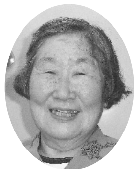
私は昭和11年1月、吉林省吉林市で生まれた。その頃は吉林で子どもが生まれるのはとても珍しかったらしく、吉林中の日本人からお祝いを貰って、6畳間がいっぱいになったと聞いた。翌年、弟が生まれた時は、そんなことはなかったから、12年には日本人の子どもが生まれるのは珍しくなくなったのかもしれない。子どもが2人できたので、匪賊討伐など危ない仕事をするのはやめたほうがいいということで、父はある人の紹介で「協和会」（官民一体の国民教化組織）に囑託で入った。

昭和15年に紀元2600年の提灯行列が吉林でも行われた。ところがその日、父は帰ってこない。仕方がないので母は隣家の人と行列を見に行ったら、父がトラックの上で太鼓を叩いていた。母は怒った、「踊る阿呆に見る阿呆、太鼓叩きのマルボウケ（マ）」と言って。4歳だったがよく覚えている。